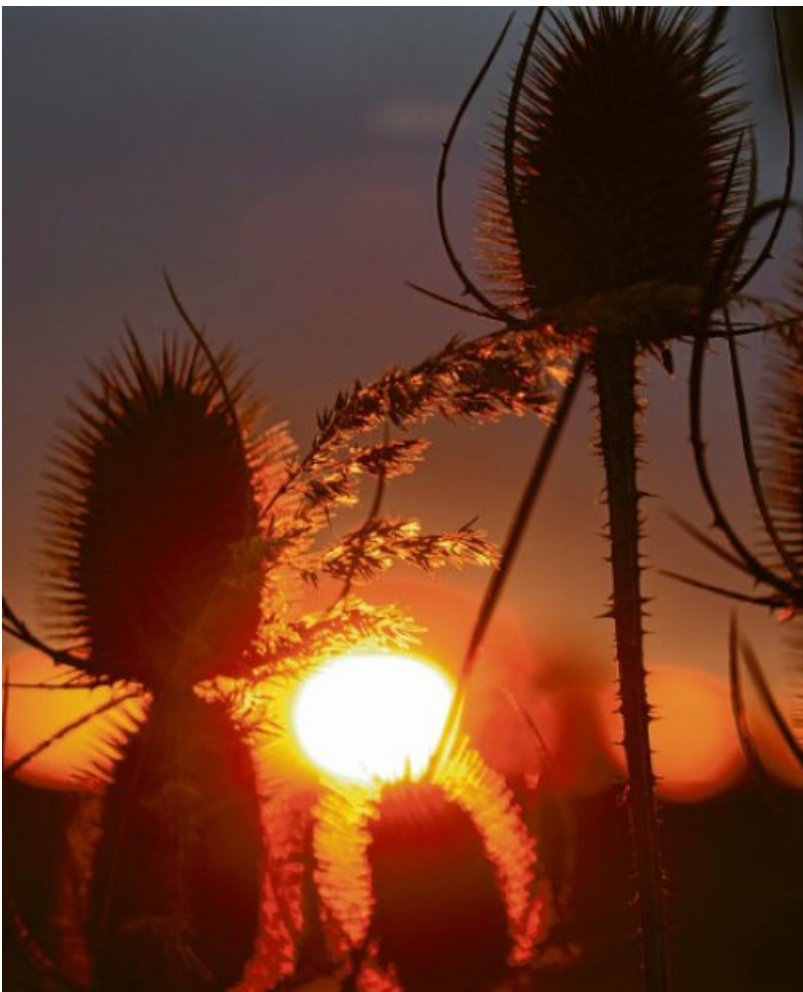
Mit einem 90-Millimeter-Makroobjektiv hat Adrian Newrick diese beeindruckende Gegenlichtaufnahme an der alten B2 bei Meitingen geschossen.