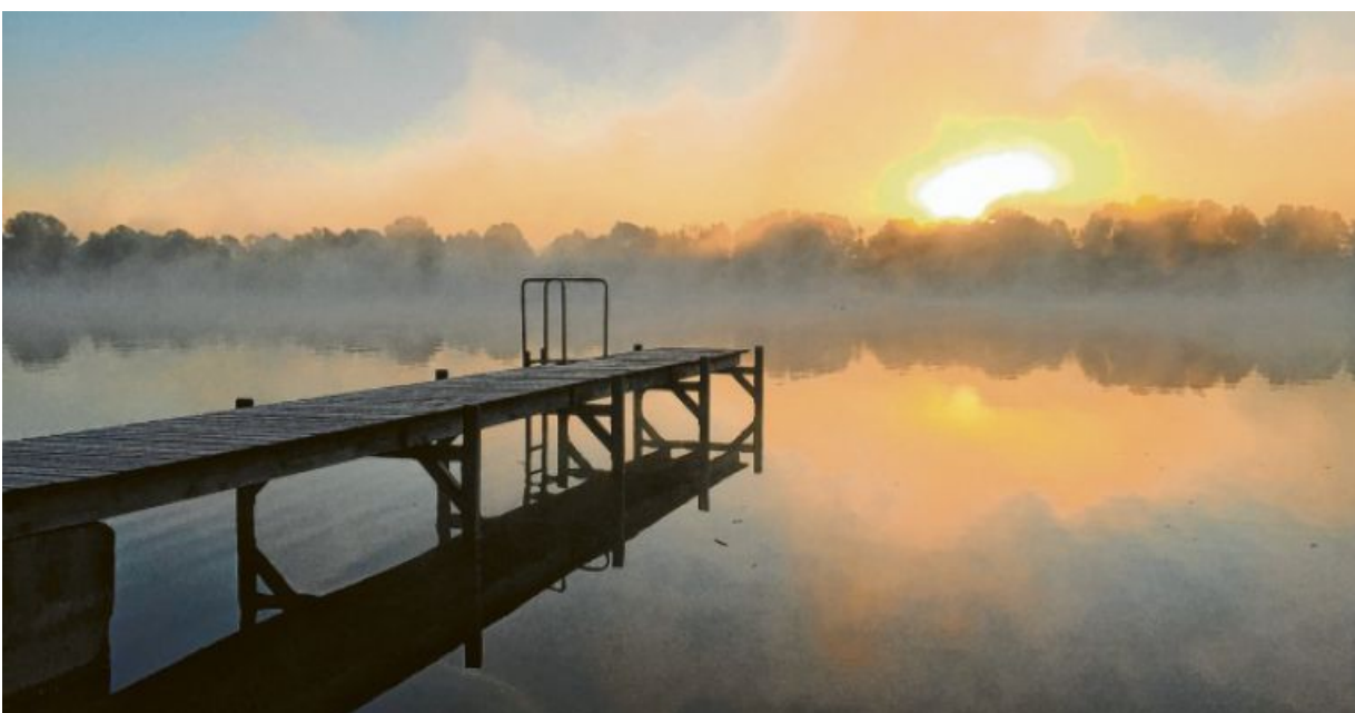
„Still ruht der See“ nennt Heidrun Kuhn ihr stimmungsvolles Bild vom Ilsesee.