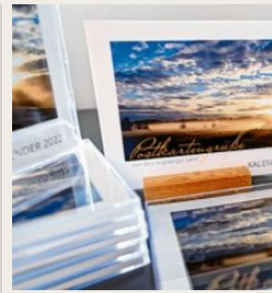
Es gibt noch Exemplare des Postkartenkalenders für 2022.

Es ist ein Geschenk mit Herz: Im vergangenen Jahr hatten die Redaktionen zu einer besonderen Benefizaktion aufgerufen. Über 100 Leser-Fotografen beteiligten sich. Herausgekommen ist eine lebendige Postkartensammlung, die sich als Kalender auf dem Schreibtisch, auf der Kommode oder im Schrank aufstellen lässt. Einige Restexemplare gibt es noch in der Redaktion der Schwabmünchner Allgemeinen gegen eine Spende von sieben Euro (oder gerne mehr). Wer Interesse hat, kann sich unter der Telefonnummer 08232/967710 melden.