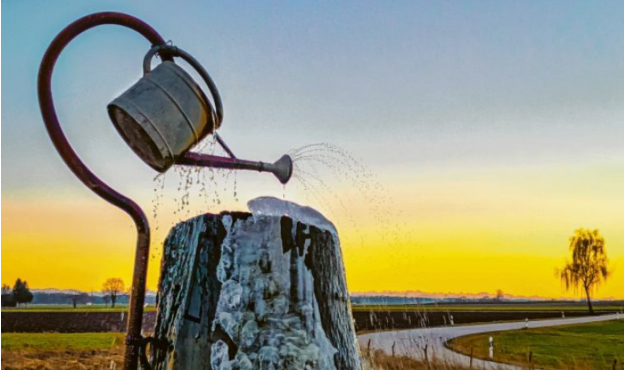
Zwischen Höfen und Forsthoften hat Jürgen Baur fotografiert. Das Bild entstand im RAW-Format mit Blende 1/1,5, ISO 50 und bei einer Belichtungszeit von 1/500 Sekunde. Es wurde danach in Lightroom entwickelt.