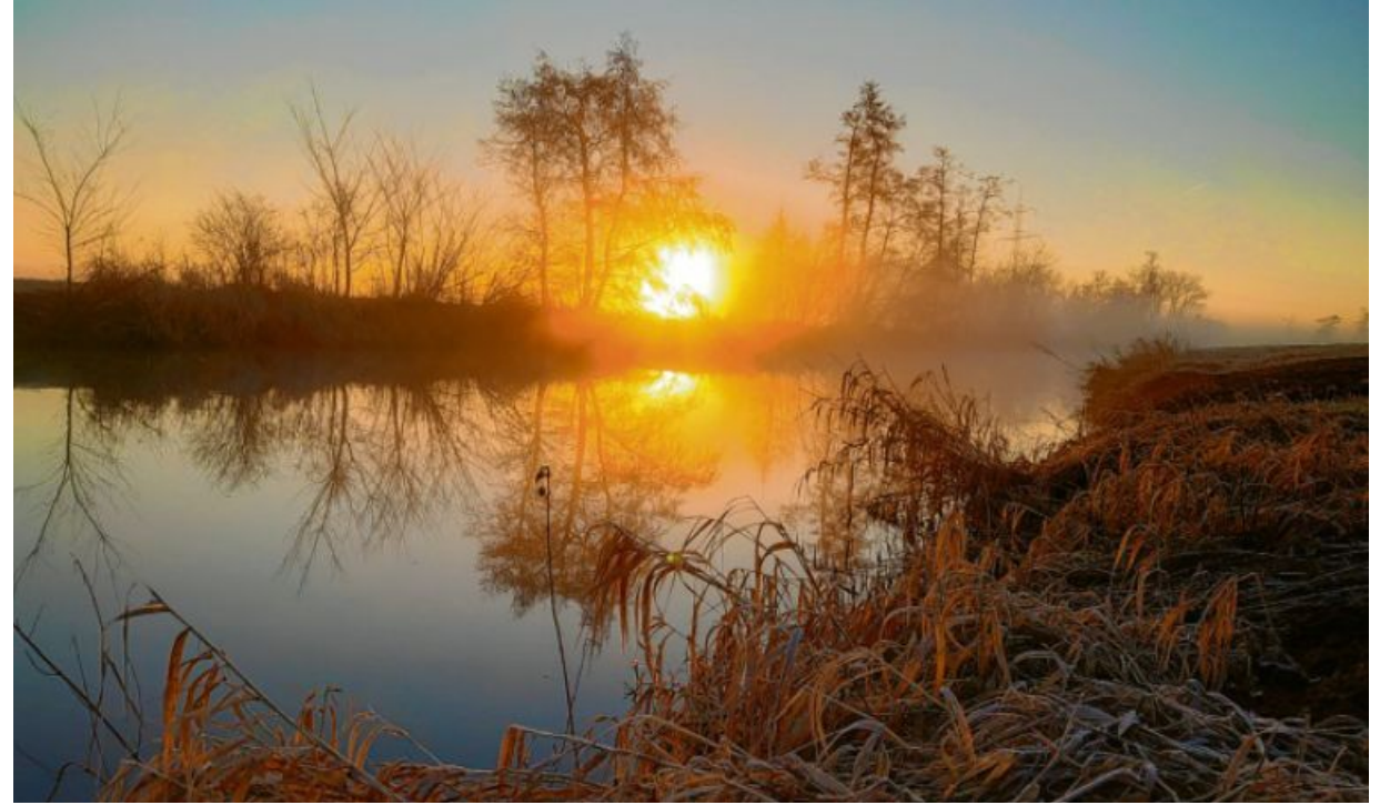
Das Foto von Stefan Handke ist in Gablingen entstanden. Es zeigt den Sonnenaufgang an der in Nebelschwaden gehüllten Schmutter. Aufgenommen wurde es bei seiner morgendlichen Walkingtour mit einer Sony Xperia 5.